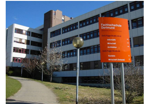
Emil-Figge-Str. 44